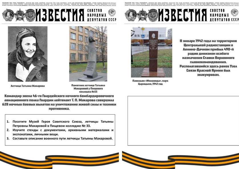
Рисунок 1. Пример фрагмента рабочей тетради, разработанной обучающимися

Проект, имеющий особую воспитательную ценность. Собирая информацию о том, где и кем работали родители, бабушки и дедушки, учащиеся не только узнают историю предприятий района, но и осознают вклад своей семьи в развитие территории.